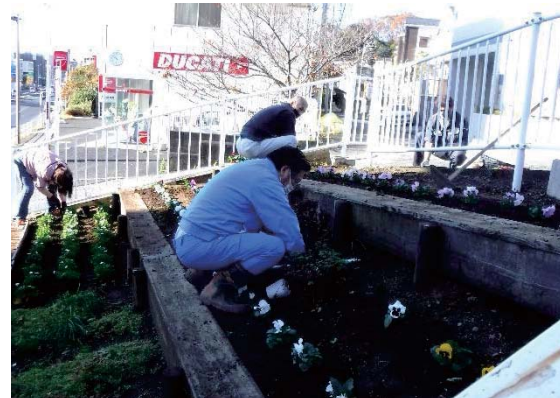
「花かおる街かど花壇」での活動状況