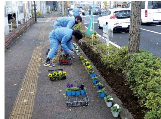
国道1号線沿い歩道花壇での活動状況