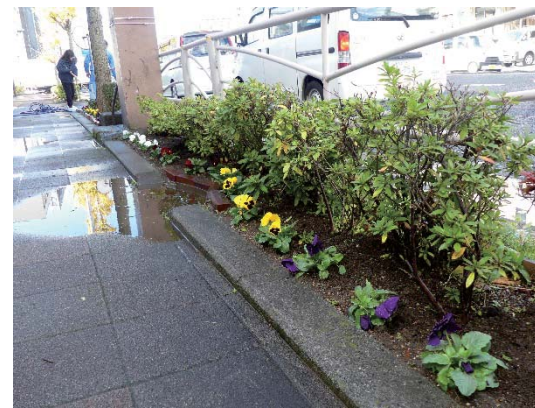
国道1号線沿い歩道花壇 本社前の写真